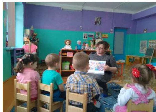
Беседа «Моя семья»