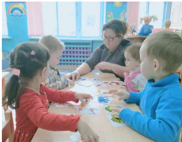
д/и «Чья мама?»